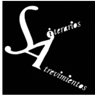
Ilustración de portada: Literarios Atrevimientos (imagen de archivo retocada)

Entidad responsable: IES Sapere Aude Av. de los Estudiantes, 4, 28229, Villanueva del Pardillo (Madrid) Tel.: 918151519