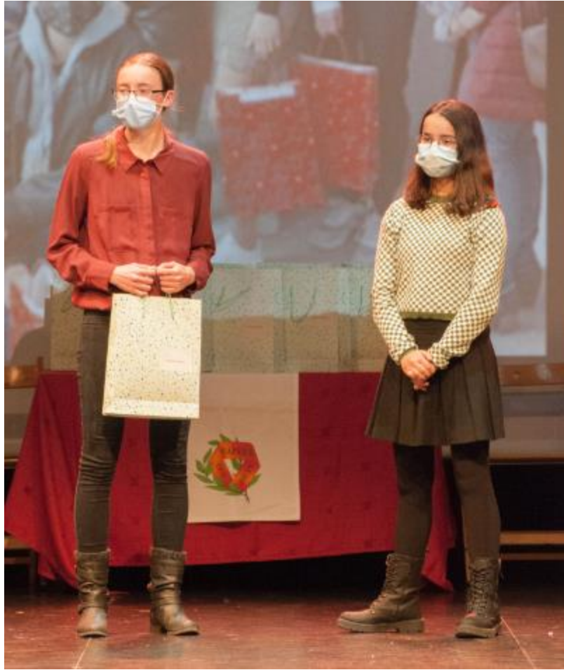
Los alumnos fueron entregando/recibiendo los premios en lo que supuso una de las más emocionantes fases del evento.