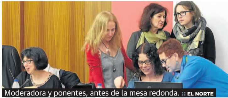
Moderadora y ponentes, antes de la mesa redonda.